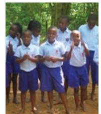
v.l.n.r.: Balletgroep, toneelgroep, nog een keer een toneel groep en een zanggroep