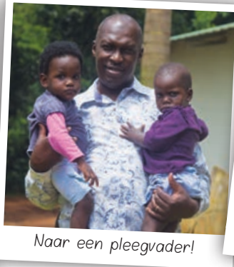
Naar een pleegvader!