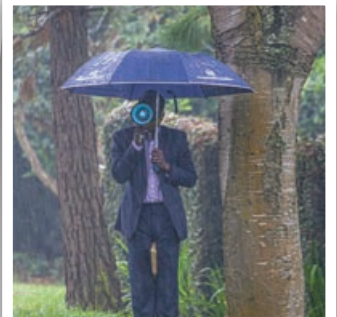
Preken in de regen