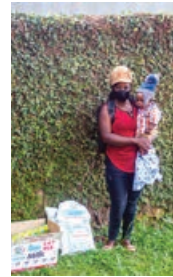
De gezinnen krijgen een voedselpakket mee naar huis