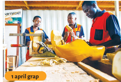
1 april grap

Deze jongens zijn bijna klaar met de basisschool en willen door naar het voortgezet onderwijs. Dit kan niet zonder voldoende sponsors.